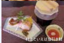
村上といえば塩引き鮭