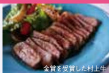
金賞を受賞した村上牛