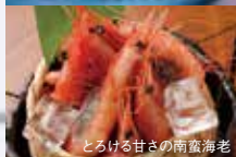
とろける甘さの南蛮海老