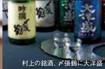
村上の銘酒、丹張鶴に大洋盛