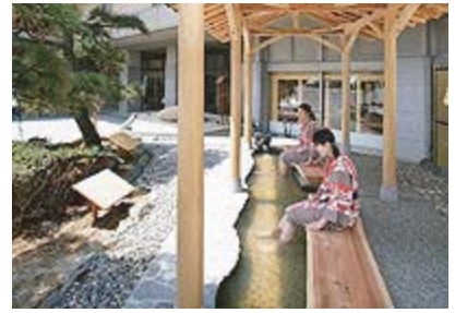
晶子の句碑散策の後は、足湯でゆっくり(汐美荘玄関前)