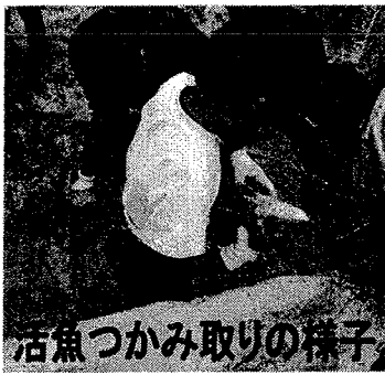
活魚つかみ取りの様子