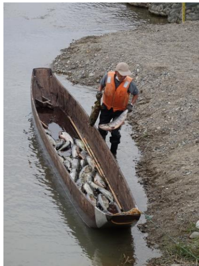
瀬波の海から遡上した鮭