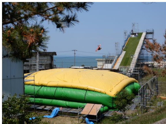
村上のヒーロー誕生の地