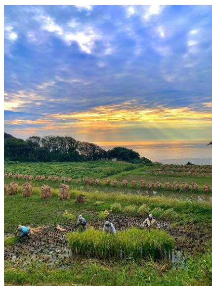
日本海を望む暮坪の稲刈り