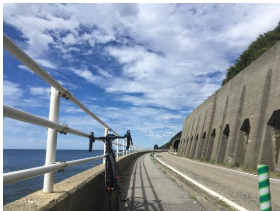
笹川流れでサイクリングGoGo